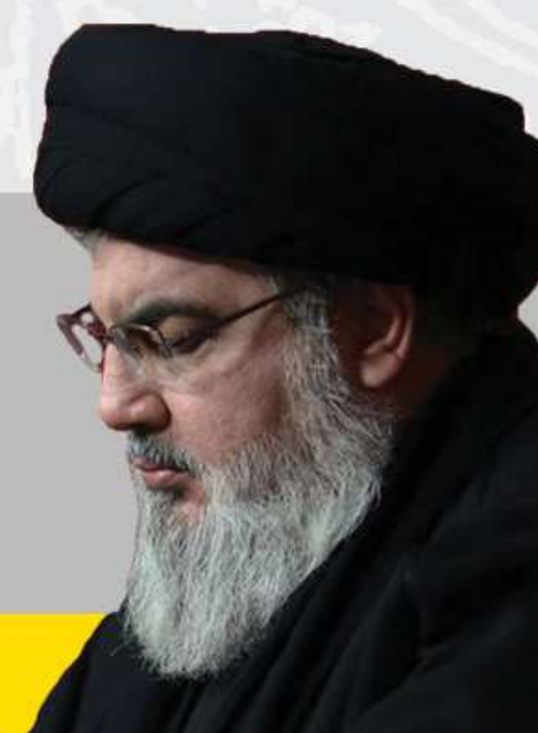
شهید سید حسن نصرالله رضوان الله علیه

هر ضربه به رژیم از سوی هر کس و هر مجموعه، خدمت به کلّ منطقه و بلکه به کلّ انسانیت است.