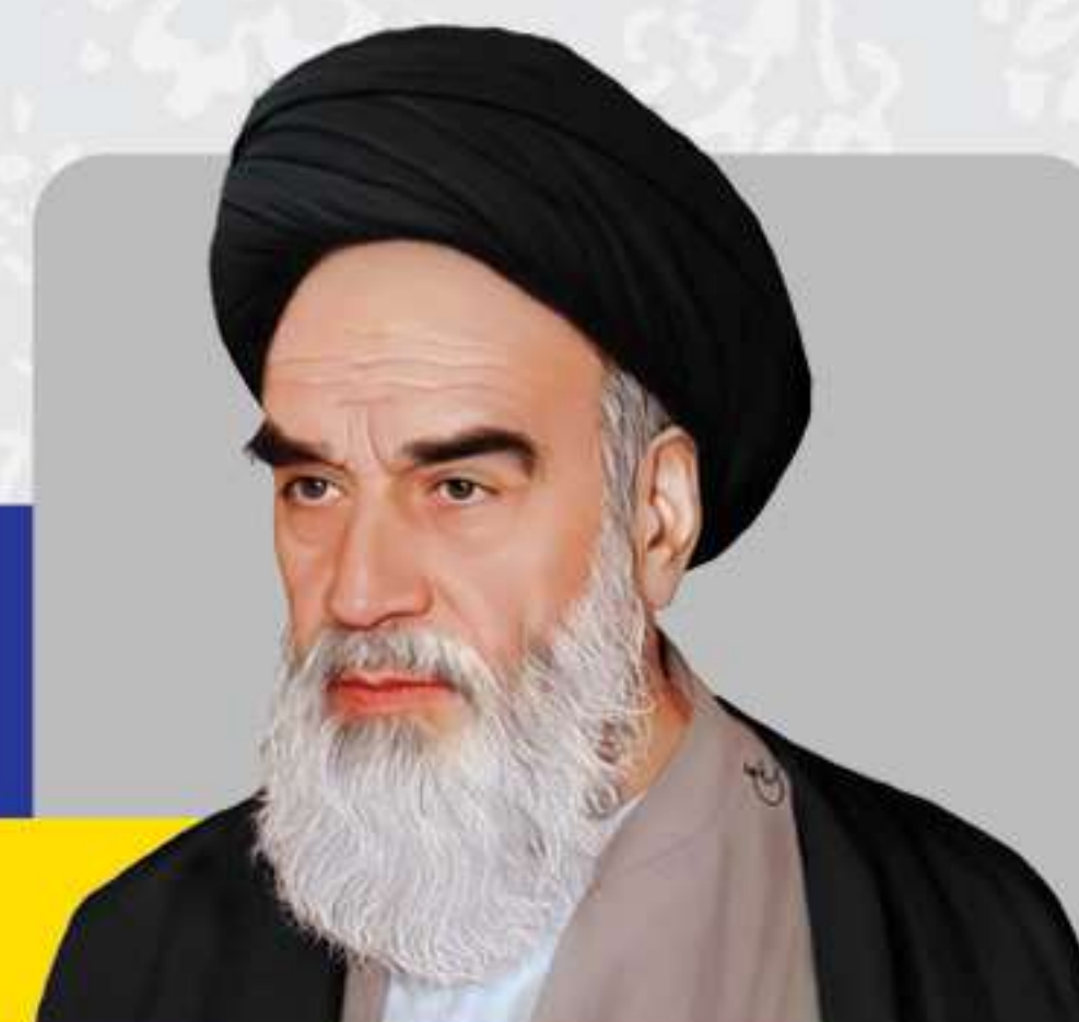
امام خمینی رحمه الله عليه

اگر مسلمین مجتمع بودند، هرکدام یک سطل آب به اسرائیل می ریختند او را سیل می برد.