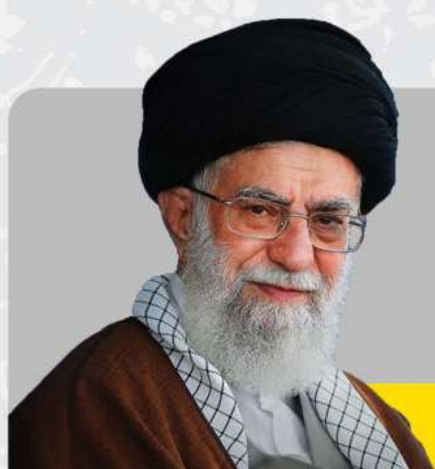
امام خامنه ای حفظه الله

اگر مسلمین مجتمع بودند، هرکدام یک سطل آب به اسرائیل می ریختند او را سیل می برد.