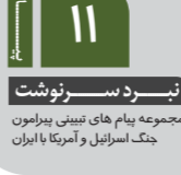
نبرد سرنوشت مجموعه پیام های تبیینی پیرامون جنگ اسرائیل و آمریکا با ایران

افزون بر این، افشاگری‌ها حاکی از آن است که برخی کشورهای عربی در جلسات محرمانه با مقامات آمریکایی، از طرح‌های تجزیه ایران استقبال کرده‌اند و رسانه‌های رسمی عربی نیز با پوشش یک‌طرفه و تشویق به جنگ، در جنگ روانی تمام‌عیار علیه ایران مشارکت داشته‌اند. خسارات وارده به تأسیسات اقتصادی، زیرساخت‌های نفتی و مراکز غیرنظامی ایران، اعدادی میلیاردی را شامل می‌شود. کشورهایی که خاک خود را در اختیار مهاجمان قرار دادند، باید در بازسازی این خسارات مشارکت کنند. تاریخ نشان داده که در شرایط بحران‌های خارجی، انسجام ملی ایران افزایش می‌یابد و ملت ایران هرگز حقوق خود را فراموش نخواهد کرد. مطالبه غرامت از کشورهای عربی همکار با متجاوزان، یک حق قانونی و ضرورت راهبردی برای ایران است تا پیام روشنی به همه همسایگان بدهد که مشارکت در تجاوز به ایران، هزینه سنگینی در پی خواهد داشت.