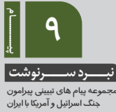
نبرد سرنوشت مجموعه پیام های تبیینی پیرامون جنگ اسرائیل و آمریکا با ایران